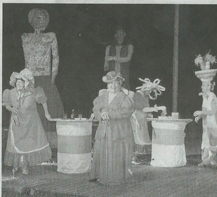
La fête, toujours au rendez-vous dans le Val d'Joly.