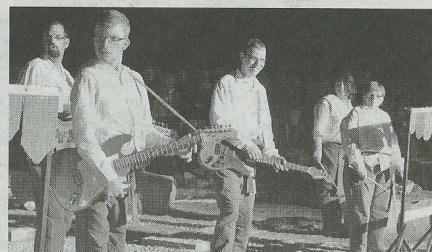
Des acteurs du monde de la pierre.

« C'est une belle aventure qui se termine. »