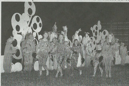
Les enfants étaient porteurs d'un message.