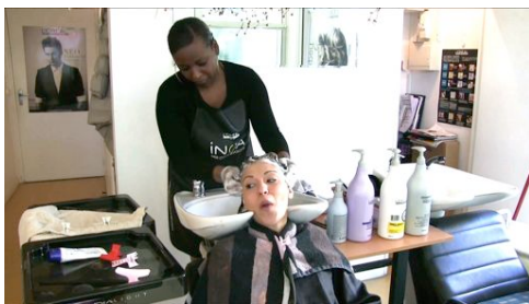
Préparation, relooking, coiffure