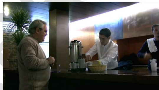
Services durant « les temps forts »